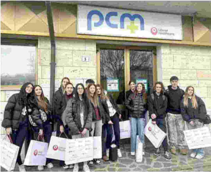
Gli studenti della classe 4G del Sigonio davanti alla sede di Pcm in via Arquà